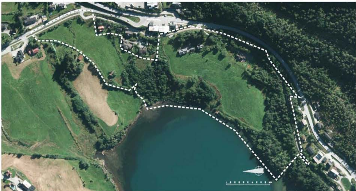
Figur 1.1: Ortofoto som syner lokalisering og avgrensning av planområdet.

Det er regulert gang samband inn til bustadområdet i nord og aust, for å knyte planområdet til dei etablerte sambanda inn mot sentrumsfunksjonar med skule og barnehage.