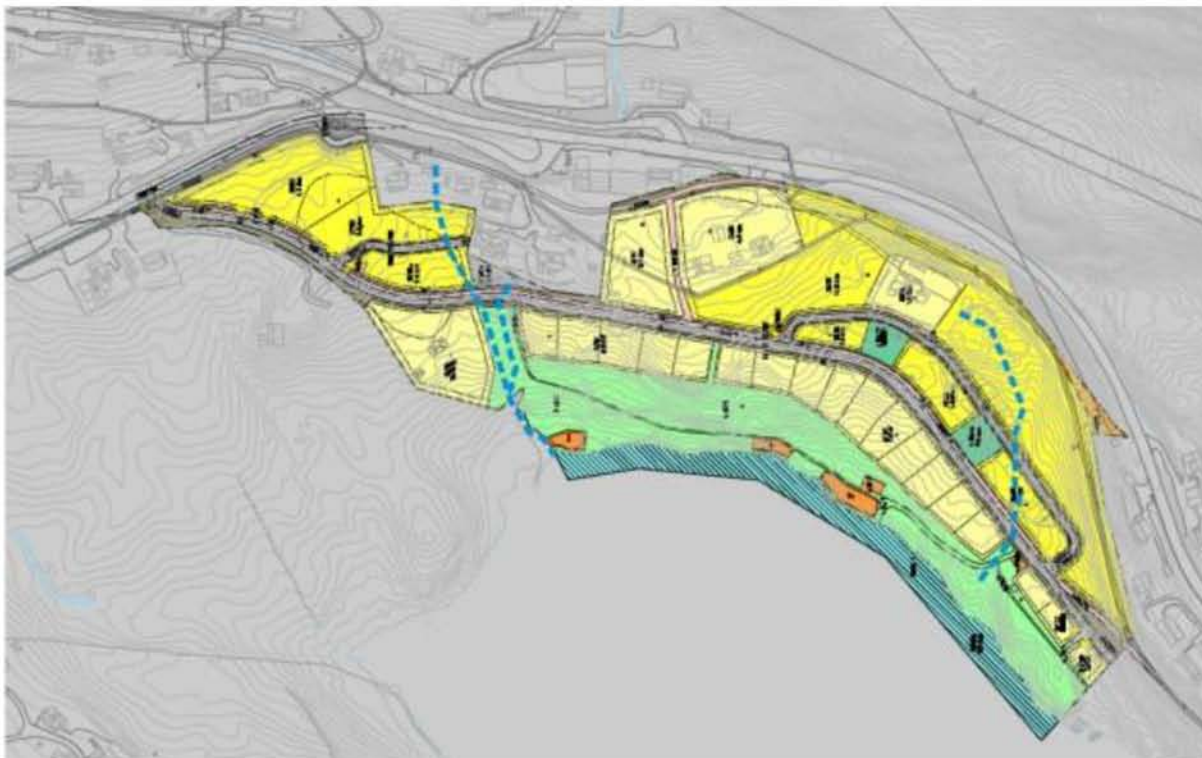
Figur 3.2: Arealbruk og registrerte/innmålte mindre bekkar markert med blå stipla strek.

Det er ikkje registrert større bekkar som det må takast særskilt omsyn til. Det er lagt til grunn at det vert teke omsyn til venta nedbørsauke ved dimensjonering av systemet for handtering av overflatevatn.