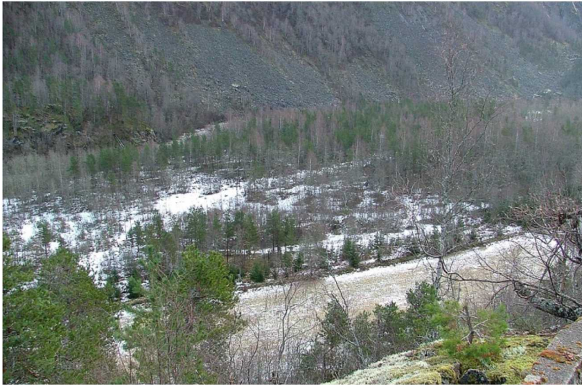
Leirmøygarden sett frå vegen til Leirdalen.

Leirmøygarden ligg i Jostedalen, ca. 9 km frå kommunesenteret Gaupne. Området er ein elvegrande på ca. 150 daa som har vorte danna av lausmassar frå elvene Leirdøla og Jostedøla. Det har vore fleire store flaumar i området, seinast i 1926 då det var storflaum i området. Dei to elvene er no regulerte. Skog har etablert seg i lausmassane; lauvskog, kratt og glissen furuskog.