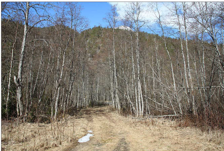
Eksisterande veg ut på FV 604 ligg i delvis sving og har dårleg sikt begge vegar.

Andre former for motorsport som snøskuter, ATV, gocart og modellbilar er også aktuelle aktivitetar.