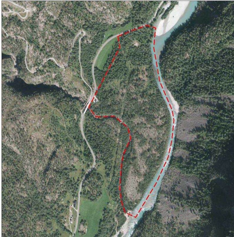
Ortofoto med planavgrensning