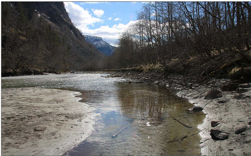
Kantsone klangs elva Jostedøla.

Samla sett vert området sett på å ha middels naturverdi.