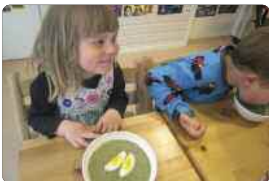
Ronja er spent på smaken.

No står granskot på planen. Av den skal me laga granskotsirup så alle får med seg eit glas heim. Det kan vera lurt å gøyma den til vinteren for etter gamle kjerringråd skal den vere bra mot sår hals, hoste og forkjøling.