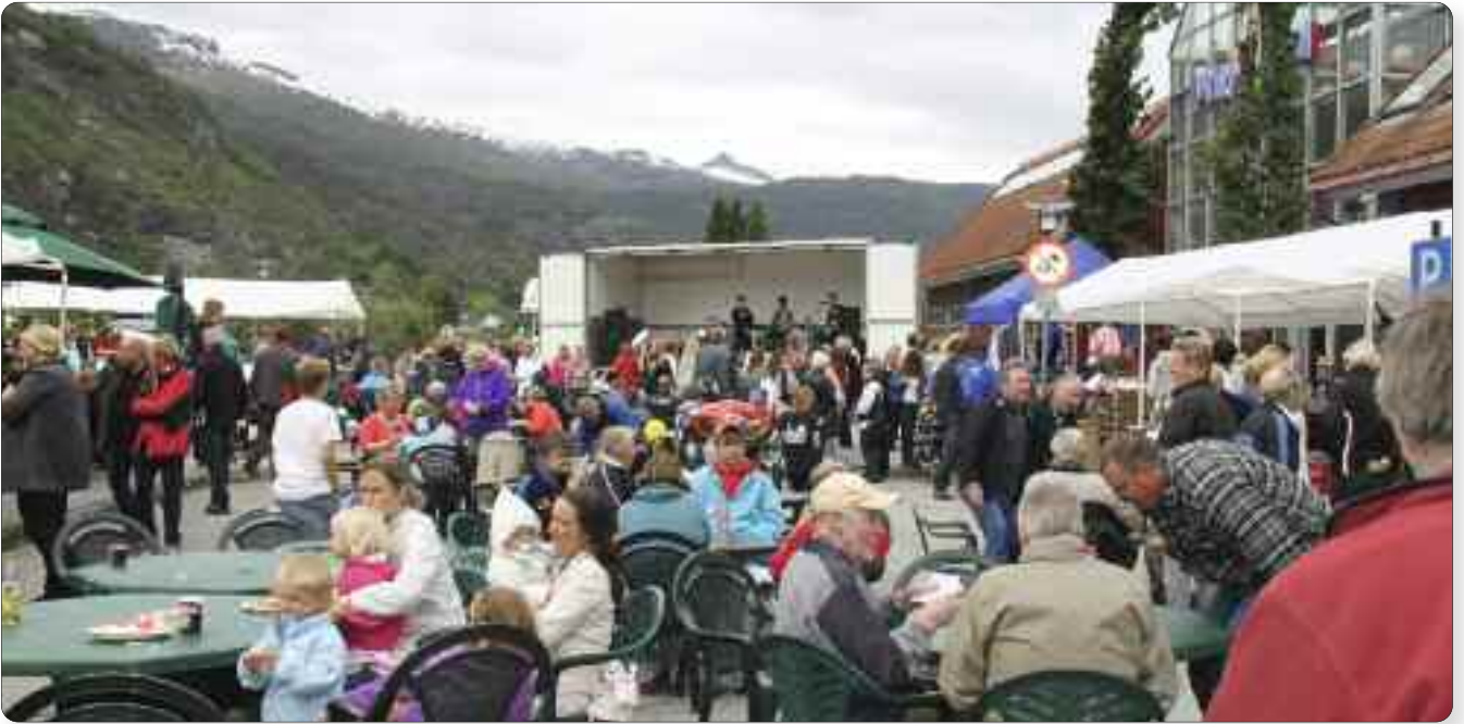
Lustramarknaden 2010 vart igjen ein folkefest.