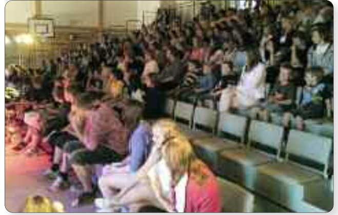
God stemning i salen.