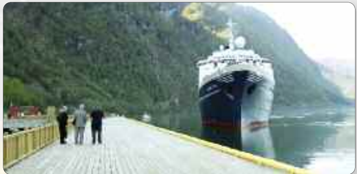
Marco Polo legg til kai