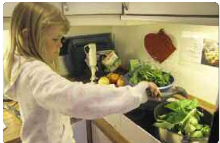
Forvelling av nesla.