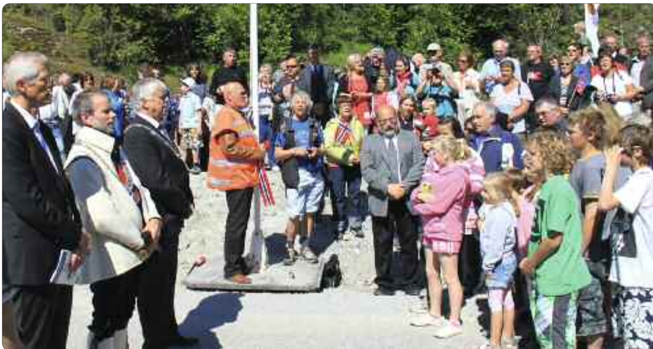
Mykje folk. Eit par hundre fekk med seg opningsseremonien 15. juni, og alle stemde i då "Ja, vi elsker" vart sunge.