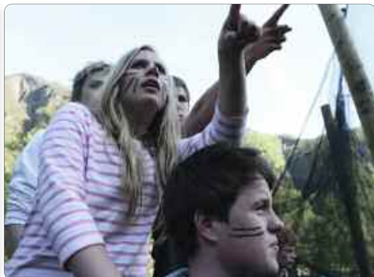
Engasjerte tilskodarar.