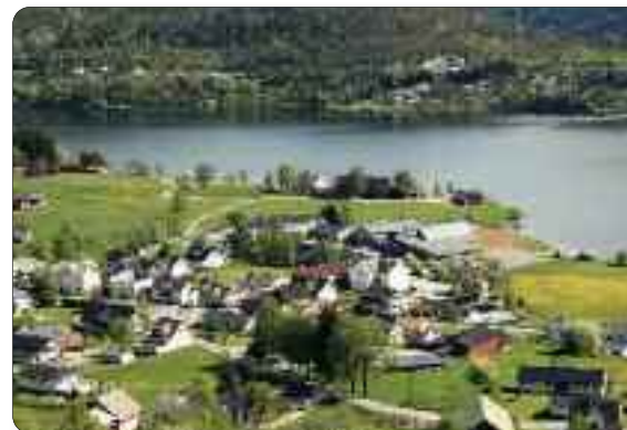
Oversiktsbilete Hafslø sentrum

Heile planen kan du sjå på servicetorget i Gaupne og på biblioteket på Hafslø. Du kan også gå inn på kommunen si