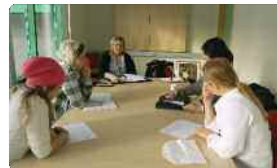
Elevrådet ved Luster vidaregåande skule.