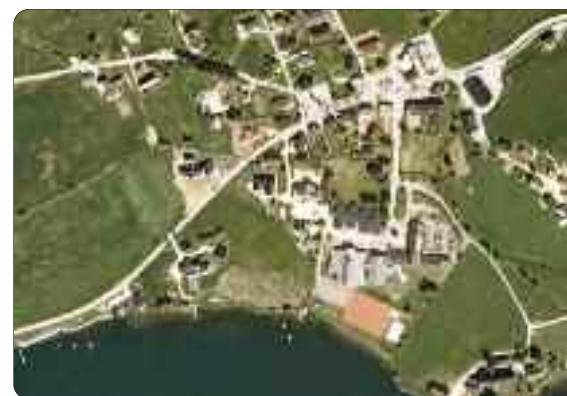
Ortofoto av Hafslø sentrum

heimeside og sjå planen under Planar, prosjekt og rapportar. Gå vidare på Kommunale planar, Regulerings- og utbyggingsplanar og så vel du Hafslø. Her finn du ei liste over alle gjeldande reguleringsplanar for Hafslø sentrum. Du finn både føresegner, plankart og saks handsaming. Du finn også plankartet på Sognekart www.sognekart.no . Start med å zoome deg inn på sentrumsområdet. I menyen til venstre vel du så Regulerings- og bebyggelsesplaner. Ved du I-knappen i menylinja øvst og trykker innanfor planområdet på kartet, får du opp eit val i venstremenyen. Ved å trykke Vis kan du no hente opp plankartet på eiga datamaskin som pdf-fil.