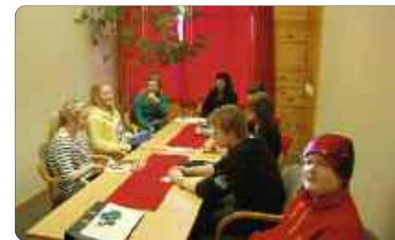
Elevrådet ved Luster ungdomsskule.