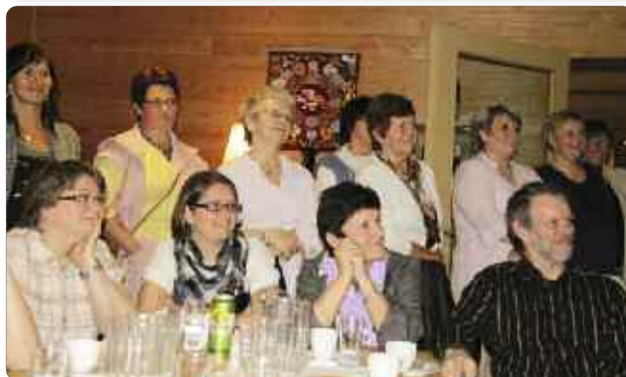
Mange lustrajenter møtte fram på tredje jentekvelden, denne gong på Gaupne hotell. Godt humør og stort engasjement.

å stå på lista. Hugs også på at me bør kumulere kvinner den dagen me går til valurnene.