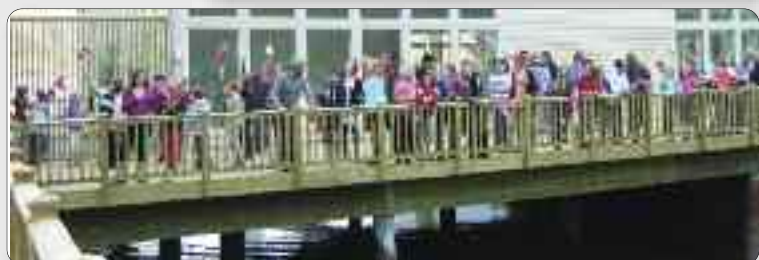
Skulen og barnehagen på Skjolden møtte opp og helsa turistane velkomne med flagg.