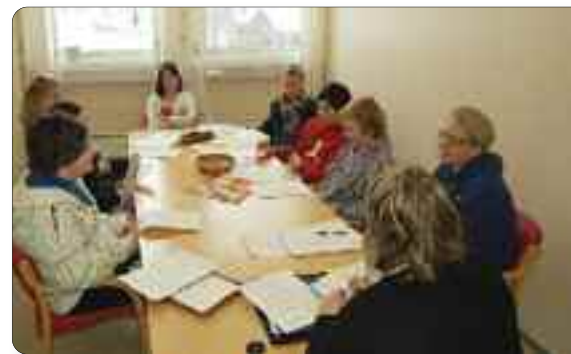
Elevrådet ved Hafslo barne- og ungdomsskule.

Der det er tilløp til disiplin-problem og mykje useriøst "prat" bør også klassekontakten bli gjort merksam på kva som er utfordringane og bli bedt om å delta på ein konstruktiv måte.