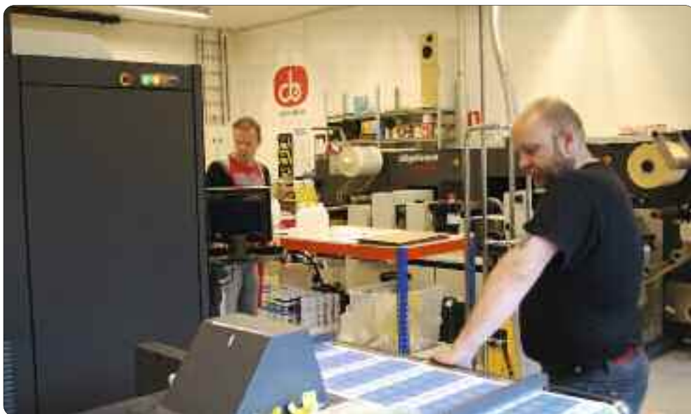
Digital Etikette skal utvide kompetansen på nye trykkeområde. Verksemda har fått eit tilskot på 65.000,-

petanseutviklingsprosjekt på nye trykkeområde.