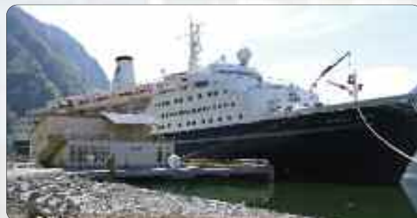
Marco Polo med det nye kaihuset i framgrunnen.