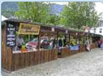
Gamle og nye tilbydarar kjem med handverk, flott kunst og god mat som kan kjøpast.