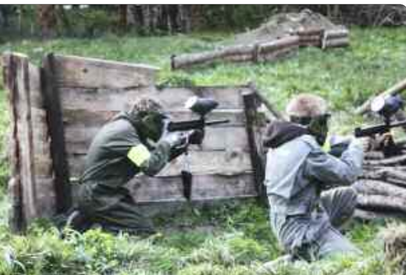
Ivrige spelarar.

flott, og super kveld med masse hyggeleg ungdom. Heldige med vêret var me óg, så sola skein på oss heilt til me skulle setje kursen attende til bussen. Ingen tvil om at dette var både populært, og kjekt på ein annleis måte. Me er glade for at me har paintballbana inni Mørkridsdalen, og Luster Paintball skal nok ikkje sjå vekk i frå at dei får besøk av ME'N'U også til neste år!