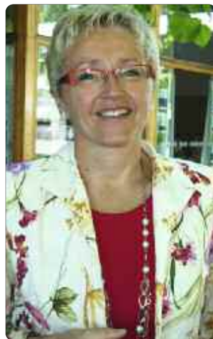
Kommunal- og regionalminister Liv Signe Navarsete sitt budskap er: - Fleire kvinner i lokalpolitikken er eit demokratisk spørsmål. Det vil gje større breidde i synspunkt og korleis vi løyser ulike saker.