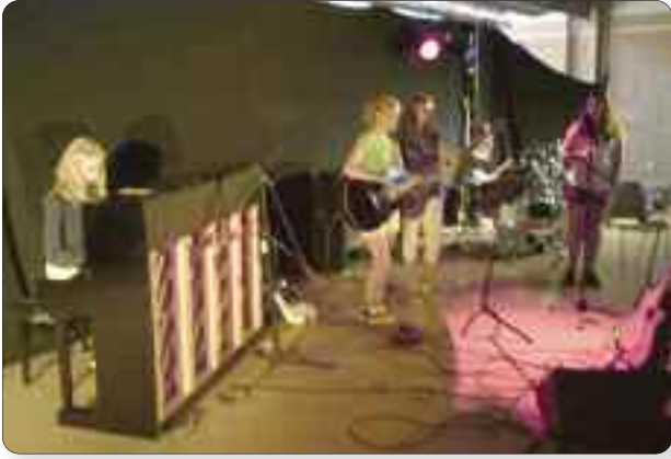
Ei av mange flotte framføringar.