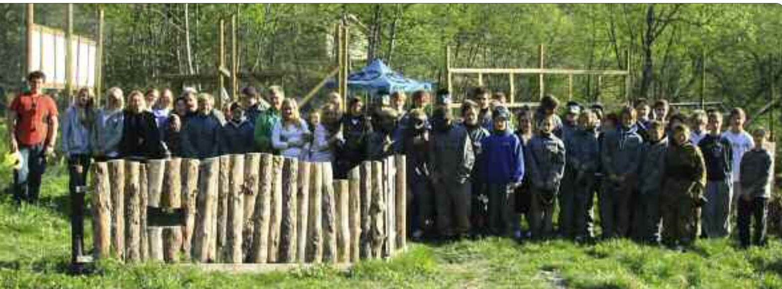
Dei fleste deltakarane.