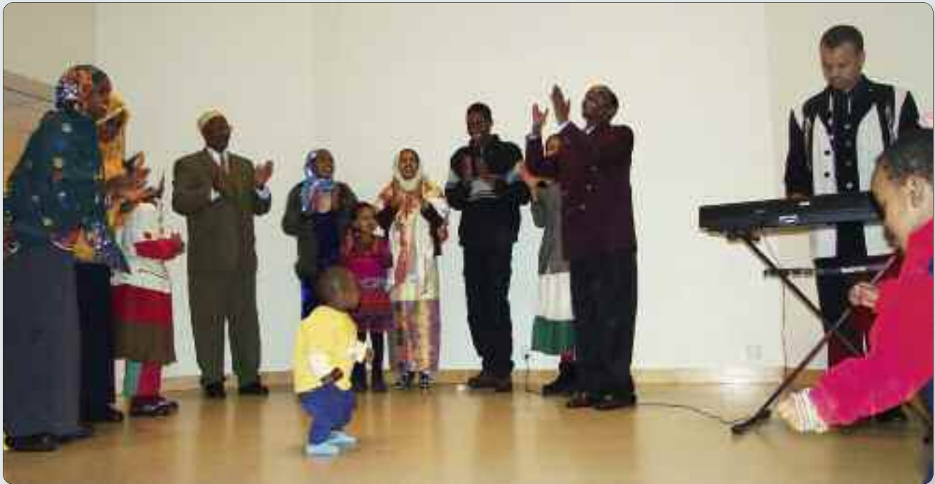
I 2000 tok Luster mot flykningar frå Etiopia. Dette biletet er frå ein velkomstfest i februar 2001 då dei imponerte med song, musikk og dans.

Introduksjonsprogram – med rett til å lære og plikt til å delta Kommunen er pliktige til å tilby eit introduksjonsprogram m/introduksjonsløn til alle personar med rett/plikt til introduksjonsprogrammet – inntil to år. Full deltaking i programmet utgjer minst 30 timar/maks 37,5 timar pr. veke. Programmet skal minst innehalde norskopplæring og samfunnskunnskap (250 timar norsk/50 timar samfunnskunnskap). Norskopplæring har ein sentral plass i integreringsarbeidet. Mange flykningar opplever skulen som ein sosial møteplass der dei møter vener og kjente. Det er lett å bli isolert i ein ny kommune dersom ein ikkje møter menneske som viser vilje til å forsere barrierar som språk og kultur. Norskopplæringa gjev rom for å stille spørsmål og dele frustrasjonar – samstundes som ein lærer norsk samfunnsliv å kjenne og deltek i språkopplæringa.