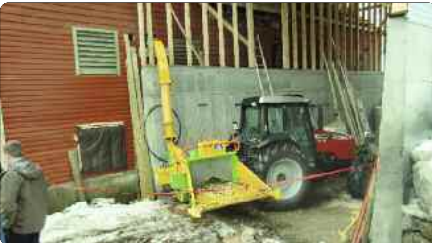
Slik ser flishoggaren ut.

Det er tilskotsordningar for produksjon av skogflisråstoff. Kravet er at virket vert seld til slik bruk eller nytta til eige flisfyringsanlegg. Tilskotet er på opptil \approx 8 øre/kWh. Ta kontakt med skogbrukssjefen om du vil vite meir om ordninga.