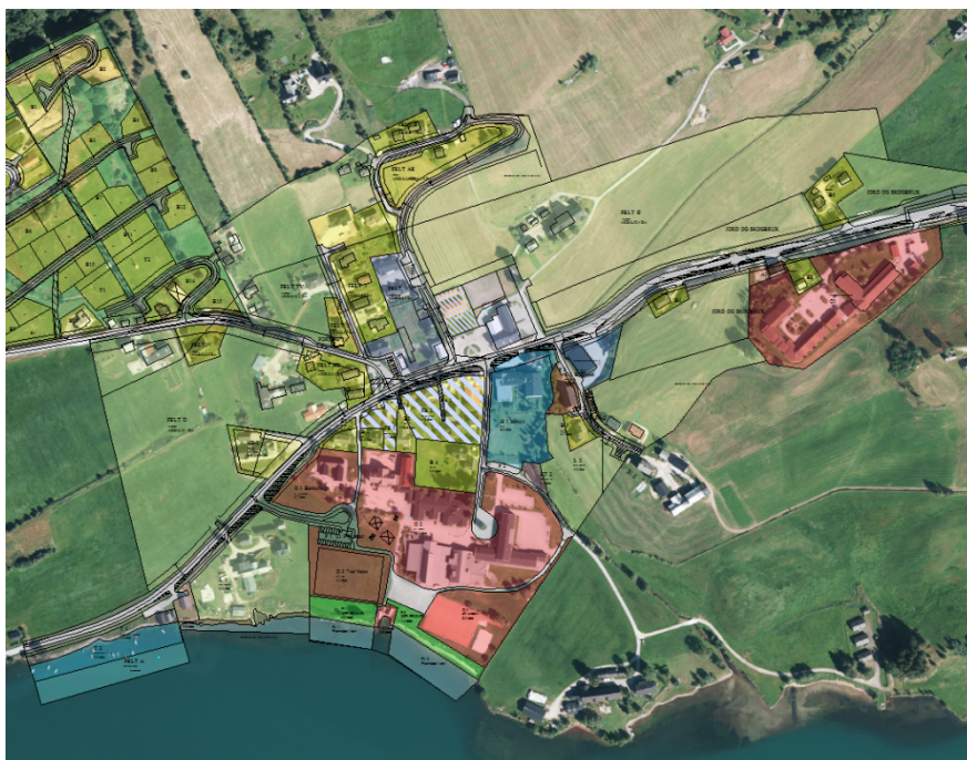
Bilde 4 Flybilete av sentrumsområdet med gjeldande reguleringsituasjon over.

Dersom ein ser bort frå areal regulert til offentleg føremål, altså skuleområdet med barnehage, så ligg sentrumet på Hafslo på begge sider av Hafslovegen. Føremål for regulering i området er i korte trekk bustad, næring (hotell, forretning mm) eller ein kombinasjon. I tillegg er mindre areal vist som