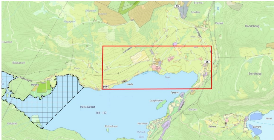
Bilde 1 Oversiktskart som viser om lag plasseringa av planområdet sett i forhold til mellom anna Hafslovatnet og Solvorn.