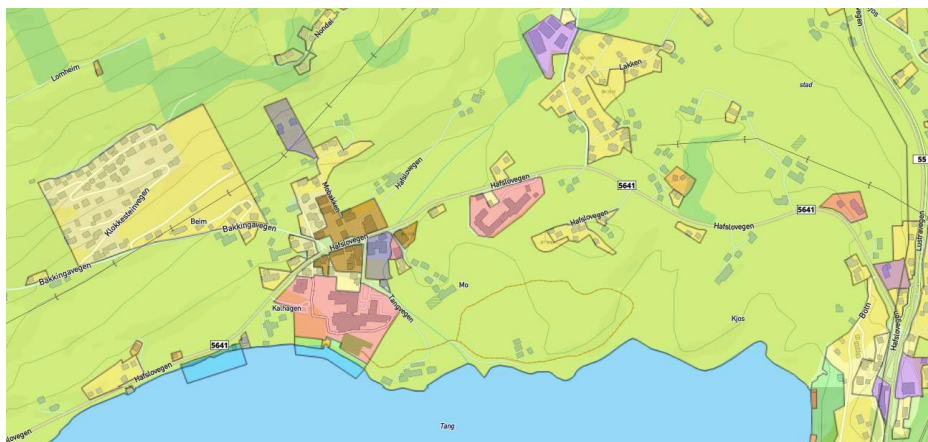
Bilde 5 Utsnitt av kommuneplanens arealdel ved Hafslø.

Hafslø sentrum er omkransa av jordbruksareal i drift. Dette er utfordrande i forhold til konflikt mellom jordvern og tilgang på areal som kan nyttast til vidareutvikling av sentrumsfunksjonar og areal til bustader. Som ein ser av oversiktskartet under, så er det også lagt til rette for ein god del bustader aust for sentrum og Hafsløvatnet, det såkalla Botn-feltet. Det vil vere ei styrke for sentrum om ein klarar å binde sentrum til desse bustadområda. Som ein del av områdeplanen bør ein sjå på mulege løysingar for samanbinding mellom sentrum og buområda for at sentrum skal bli attraktivt for dei omkringliggjande buområdene.