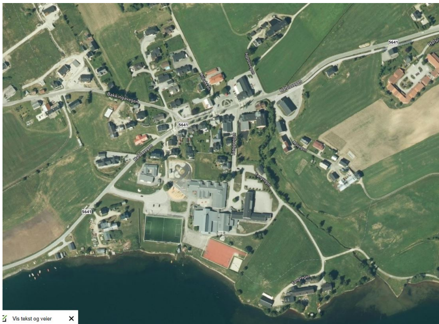
Bilde 3 Flybilete av sentrumsområdet

Som ein ser av flyfoto så utgjer skulebygga ein stor del av sentrumsområdet på Hafslo. Innanfor området er det barneskule, ungdomsskule og barnehage. Her var det tidlegare også yrkesskule, men den er nedlagt i seinare tid. Det gamle yrkesskulebygget skal delvis gjerast om til barnehage, og noko areal er ledig/ tilgjengeleg for andre føremål. Innanfor planområdet er det ein barnehage til. Denne som vert kalla Gamlestova ligg lengre aust rett ved Hafslovegen like etter nedkøyringa til bustadfeltet Botn. Områdeplanen skal vurdere framtidig bruk av dette bygget/ denne tomte. Areal regulert til offentleg føremål utgjer om lag 32 daa pluss regulert parkeringsareal.