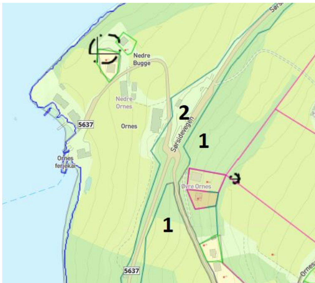
Figur 2 Planområdet er avsett til LNF-føremål i arealdel til kommuneplanen.