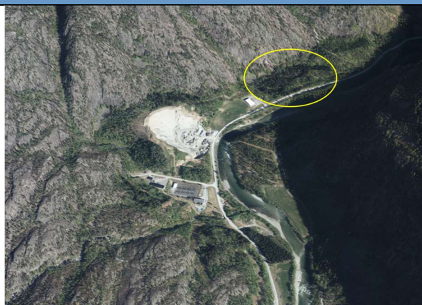
Figur 2 Området sett i frå sør i 3D flyfoto