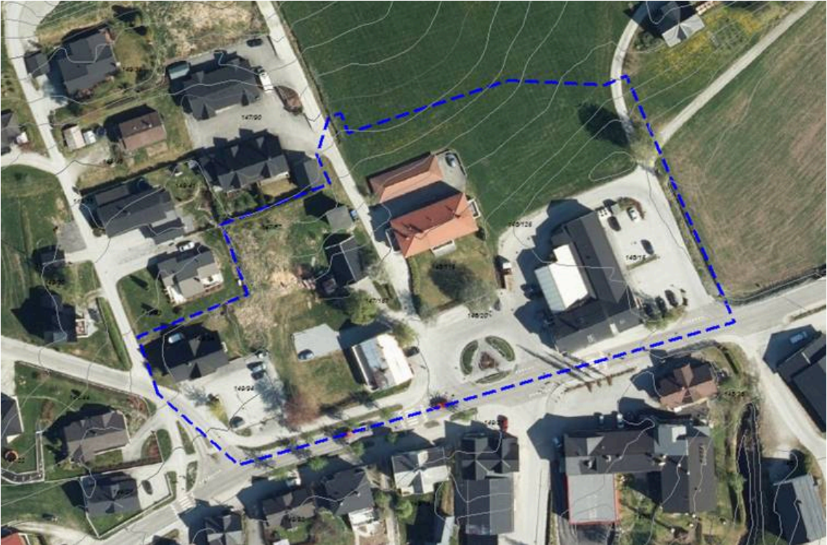
Illustrasjon 1: Forslag til planavgrensning lagt på flybiletet.