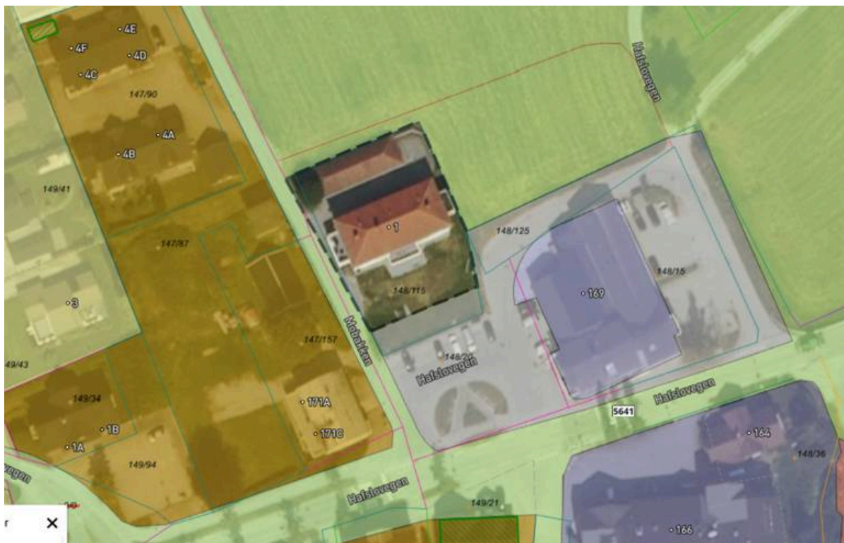
Illustrasjon 3: Høyringsforslag til kommuneplanens arealdel.

Når det gjeld ressursar til dette planarbeidet, så ser komunedirektøren for seg at Luster kommune sjølv står for varsling av planarbeidet og forarbeidet. Det er likevel slik at her må ein ned på ganske høg detaljeringsgrad både med omsyn til trafikale forhold, arkitektur og liknande, slik at det må leigast inn noko fagkompetanse. Om dette vert i form av einskilde fagutgreiingar, eller om det vert heile planarbeidet, vil komunedirektøren bruke litt tid på før ein konkluderar.