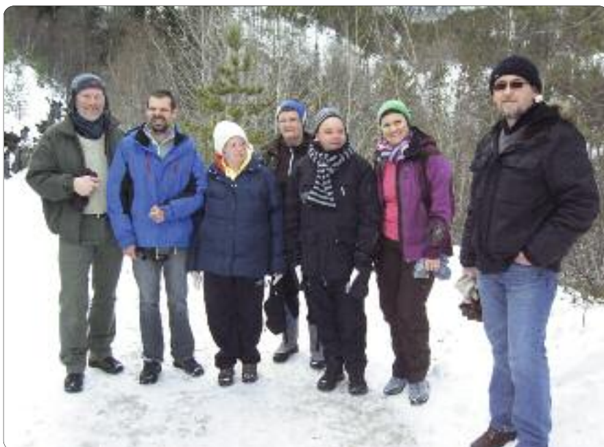
Fjellvegen på Røneid er eit ypparleg alternativ for den som likar trim i naturen.