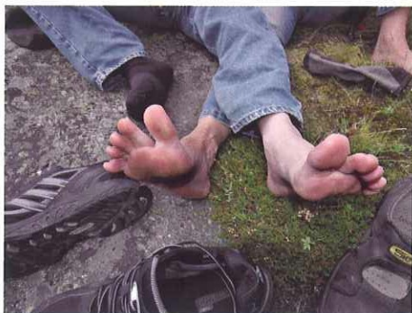
Glade tær vert vener: Fridom er blant anna å kunne bestemme sjølv når skoa skal av.