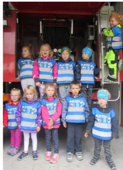
På brannstasjonen i Luster