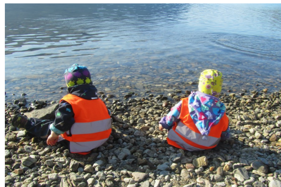
Turdag til stranda ved Ekservollen