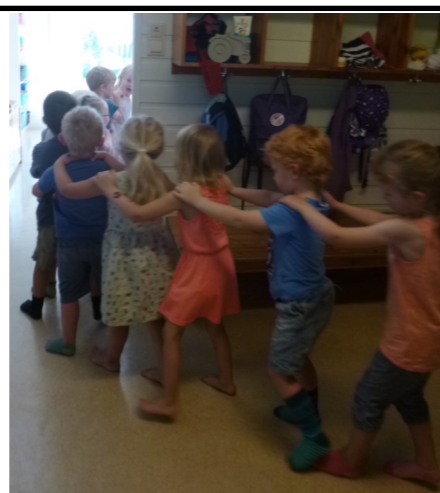
På vei inn til lunsj

I barnehagen har vi ingen obligatorisk tid, men vi vil gjera merksam på at dei fleste aktivitetane startar opp ca kl 9.15. Dersom vi skal ha ein aktivitet som startar opp før kl 09.15 eller sluttar etter kl 14.00 så vil det bli informert om det. Ved eventuelle spontane turar set vi opp lapp på ytterdøra om kvar vi er.