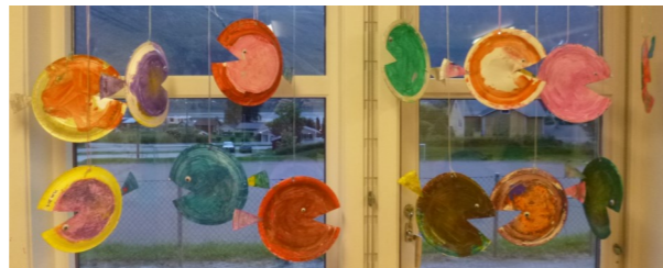
Tema : fiskesprell