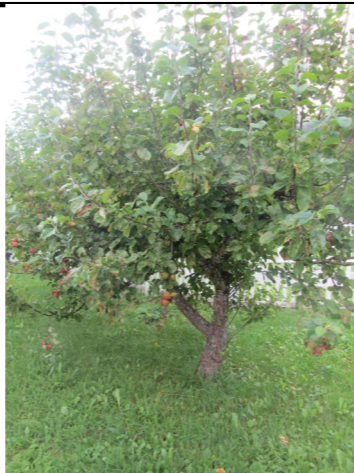
Epletreet til L vetann

Naturen gir rom for eit mangfald av opplevingar og aktivitetar til alle årstider og i all slags v r. Naturen er ei kjelde til vakre opplevingar og gir inspirasjon til estetiske uttrykk. Fagområdet skal bidra til at barna blir kjende med og f r forst nding for plantar og dyr, landskap,  rstider og v r. Det er eit m l at barna skal f  ei gryande forst nding av kor viktig ei berekraftig utvikling er. I dette inng r kj rleik til naturen og forst nding for samspelet i naturen og mellom mennesket og naturen.