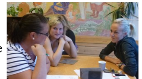
Foreldremøte hausten 2015