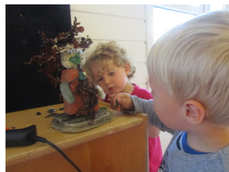
Av det vi fant laga vi ei sj heks