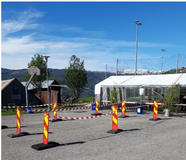
Oppsett kiosk ute