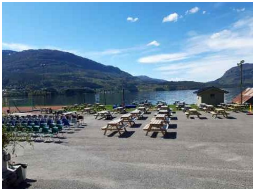
Stolar og bord ute