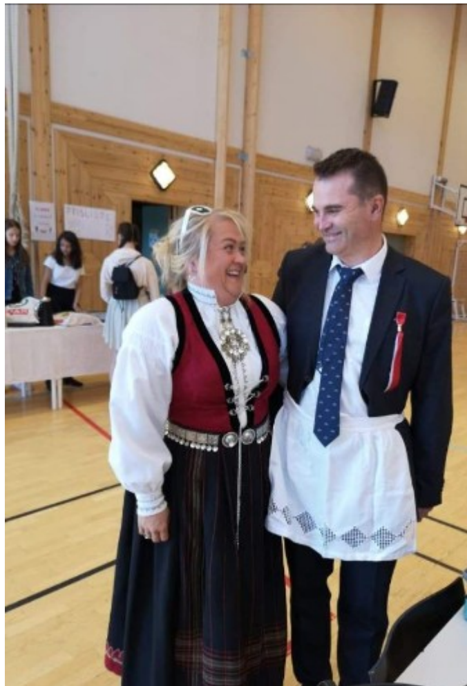
Delar av 17.maikomitèen 2019 klare til innsats!

I sum: KULL2005 var særers nøgd med gjennomføringa av 17.maiarrangementet i 2019, og vonar at framtidige kull kan nytte seg av dei val og erfaringar vi har gjort!