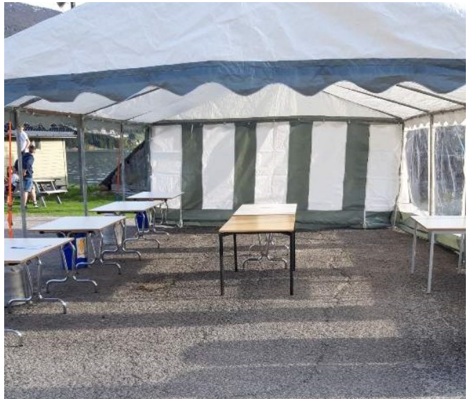
Oppsett kiosk ute